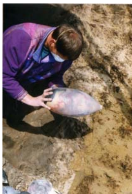
Bild 6: Nach zwei Tagen wird die Grube abgedeckt, die gebrannte Ware wird sichtbar.

Der Brand dauert etwa fünf Stunden, immer wieder muss Brennholz nachgelegt werden. Anschliessend wird die Grube mit Wellblech zugedeckt.